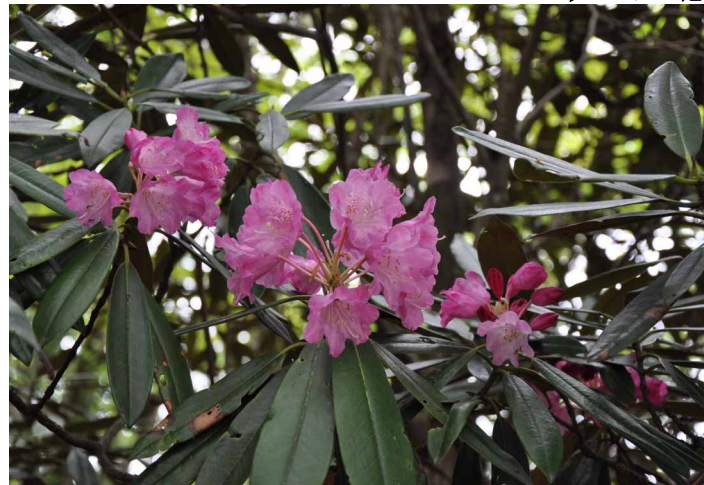
▲ 色の濃いシャクナゲの花